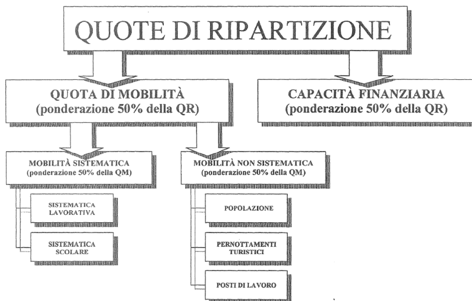
Figura 2 Costruzione della chiave di ripartizione intercomunale PTL

Il meccanismo prevede l'aggiornamento costante della chiave di riparto, a scadenze triennali, in funzione dell'evoluzione dei parametri statistici utilizzati per il calcolo.