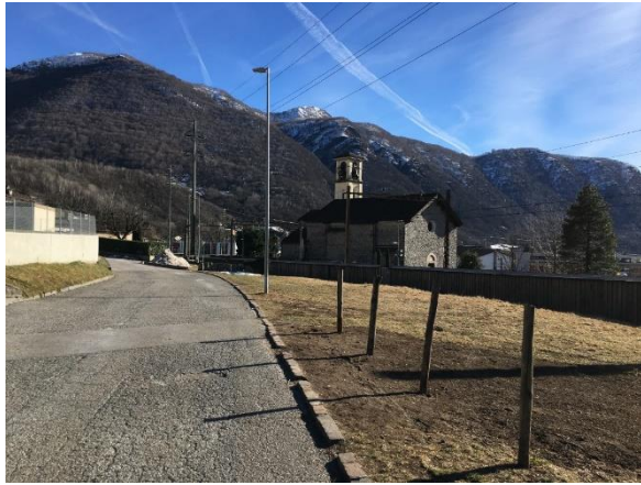
Il terreno oggi

Secondo il Piano regolatore vigente a Bironico il terreno è inserito nella Zona AP-EP (Zona dedicata ad attrezzature pubbliche ed edifici pubblici): la funzione prevista per il nuovo parcheggio, a disposizione delle Scuole elementari, è quindi rispettosa delle Norme di attuazione del Piano regolatore.