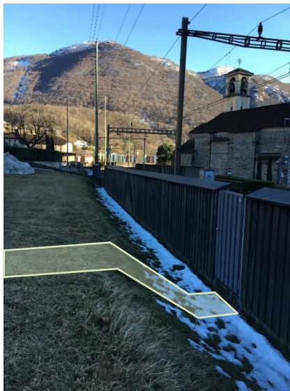
La via di fuga FFS, a partire dalla quale una fascia di terreno va mantenuta libera