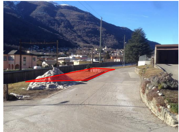
L'area (perimetro indicativo) da adibire a parcheggio

l'illuminazione pubblica (candelabri, lampioni) è stata valutata sufficiente e non richiede modifiche.